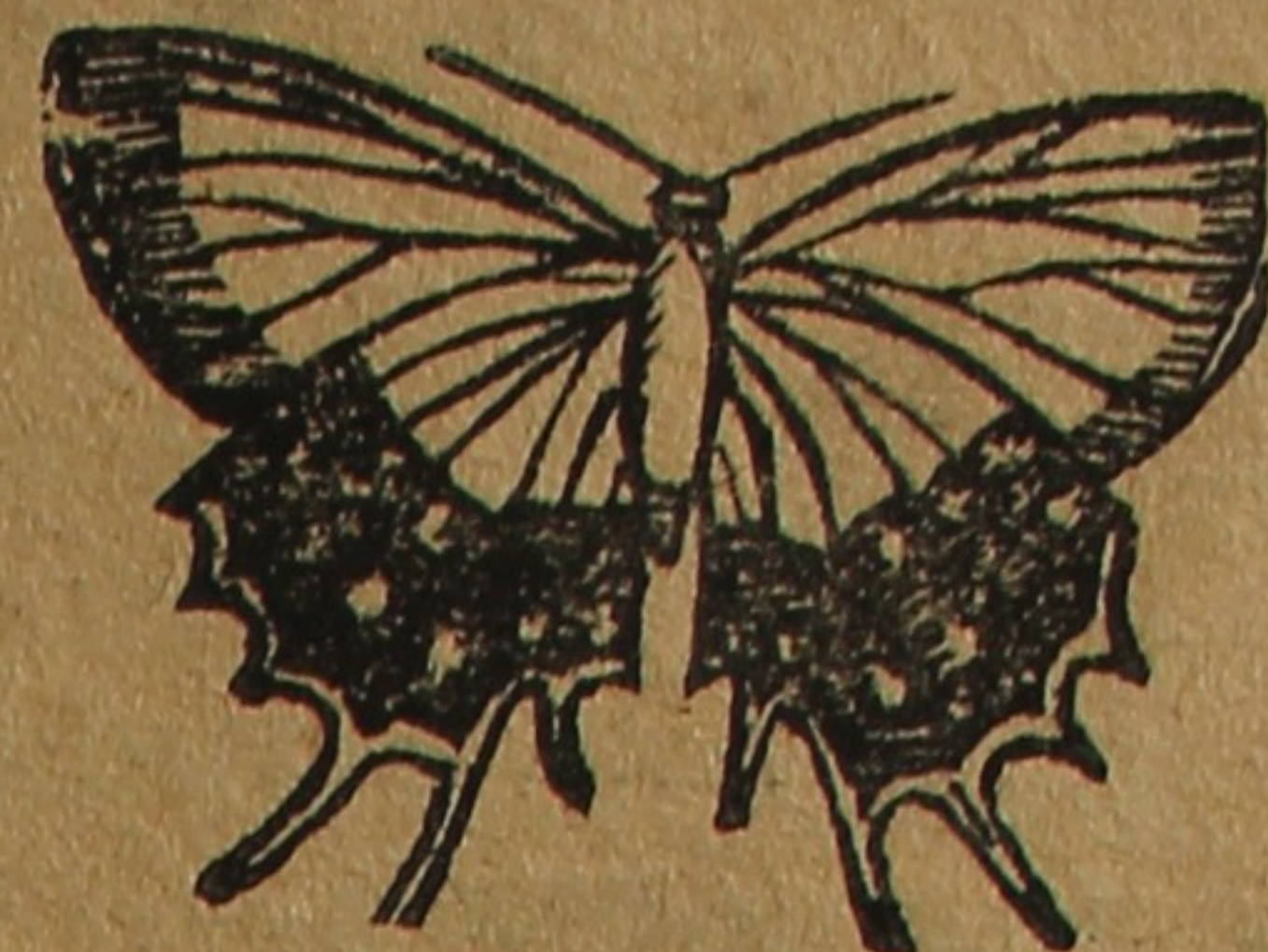
Senhorita Borboleta dos O- lhos de Brillhante.